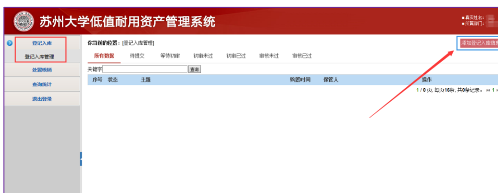
图 2 添加登记入库信息操作

教职工用户进行低值资产登记入库的操作方式如图 2 所示，通过“添加登记入库信息”按钮填写低值耐用资产入库单信息。