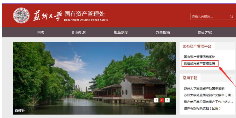
图 1 苏州大学低值耐用资产管理系统链接